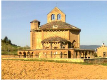
Tempelridderkirken "Eunate" ved Puenta la Reina. Et must for den nysgerrige pilgrim.

De forskellige pilgrimsruter til Santiago. Den mest befærdede og velorganiserede rute er "den franske vej" som på kortet her er fremhævet. På denne rute er der hundredevis af herberger.