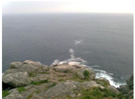
Finisterre, vejens ende.