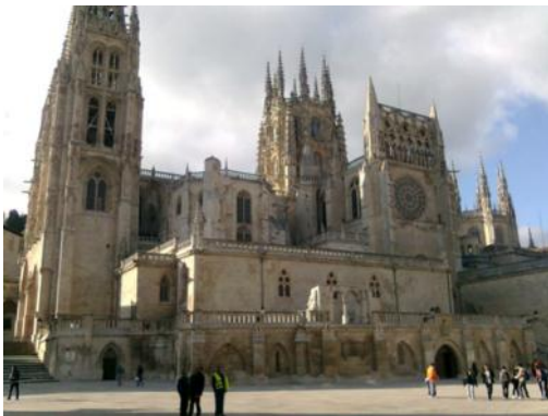
Katedralen i Burgos